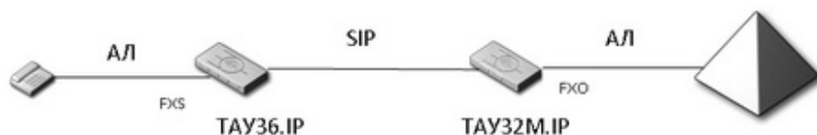
Схема включения следующая:

Нумерация абонентских портов на обоих шлюзах может быть произвольной. При входящей или исходящей связи эти номера никак не фигурируют в биллинге АТС. Но на TAU36 рекомендуется нумеровать порты из пула номеров в соответствии с планом нумерации подключаемой АТС. TAUxx и TAU32M способны работать между собой как с участием проху-сервера, так и без него. В зависимости от этого настройка части SIP будет отличаться.